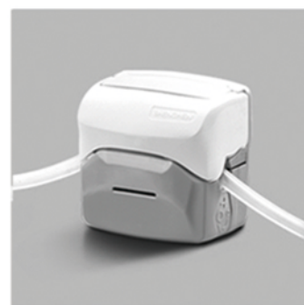
4. 向下合上泵头翻盖，完成软管安装。