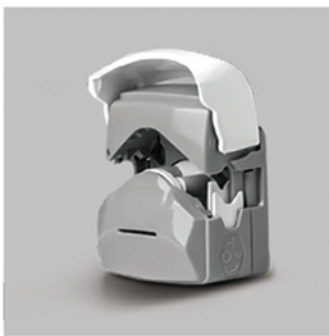
1. 向上掀开泵头翻盖，打开泵头。