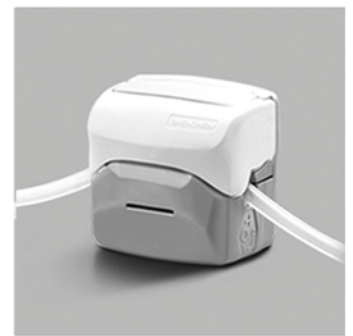
4. 向下合上泵头翻盖，完成软管安装。